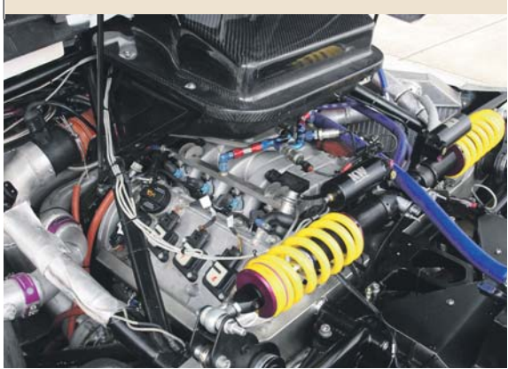
Downsizing: Eine Kurzhub-Kurbelwelle reduziert den Hubraum des V8-Biturbo auf 3,3 Liter