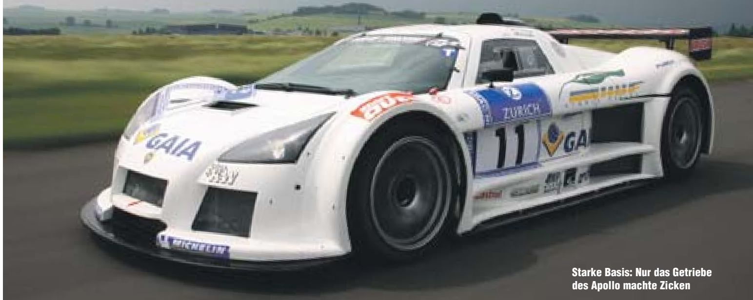
Starke Basis: Nur das Getriebe des Apollo machte Zicken

Sportwagen mit Hybridantrieb umgestrickt zu werden: kompakte Abmessungen, geringes Gewicht, V8-Biturbo-Mittelmotor sowie die dem Rennsport entlehene Architektur des Fahrwerks mit doppelten Querlenkern an allen vier Rädern. „Der Apollo ist solide und mit rund 1100 Kilo im Renntrimm sehr leicht“, fasst Kreyer zusammen.