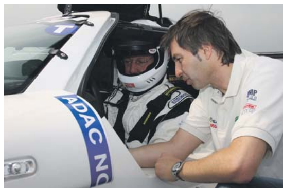
Geduldiger Lehrer: Ex-Formel 1-Star Frentzen erklärt dem auto motor und sport-Tester die Feinheiten des Hybridantriebs