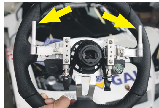
Fingerübung: Im manuellen Modus gibt man mit dem rechten Hebel E-Gas. Ziehen links heißt: Batterie laden