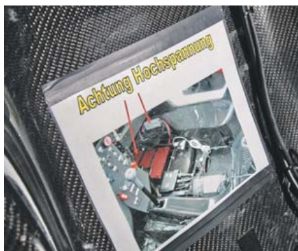
Vorsicht! Ins Cockpit geklebter Hinweis für die Streckenposten

Basis des HHF Hybrid ist ein Gumpert Apollo. Der im sächsischen Altenburg in einer Kleinserie gefertigte Sportwagen verfügt über die perfekten Gene, um zum ersten GT-